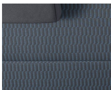
+ Stoelbekleding Cran Blauw