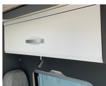
+ Meubeldecor Amberes Oak, Trace Dark Grey