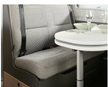
+ Bekleding Scandi