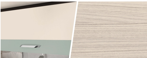
+ Meubeldecor Tindari Bora