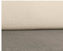
+ Bekleding Kapan