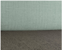
+ Bekleding Timor