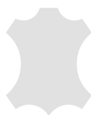
+ Echtlederen bekleding, individueel *