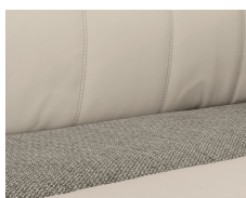
+ Bekleding Chaleur