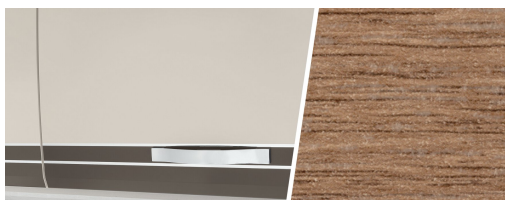
+ Meubeldecor Virginia Eiche