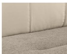
+ Bekleding Torcello