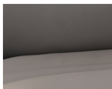
+ Echtlederen bekleding Collin *