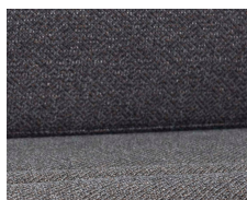
+ Bekleding Melia *