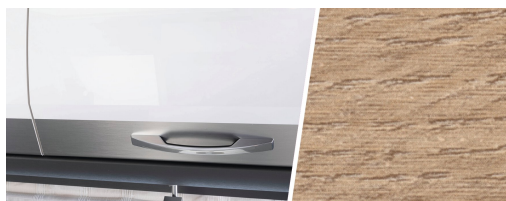
+ Meubeldecor Amberes Oak