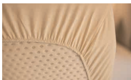
» Koudschuimmatrassen bij alle vaste één- en tweepersoonsbedden