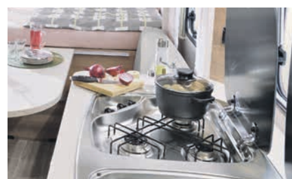
» Praktisch 3 pits gasfornuis