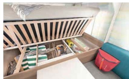
» De latten van de lattenbodem zijn geplaatst in rubber houders. Opklapbaar voor optimaal in- en uitladen.