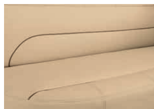
+ Skylight (Echtleder, optioneel)