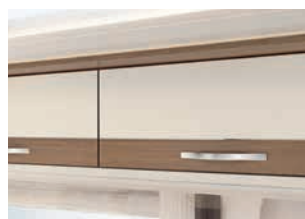
+ Virginia Eiche