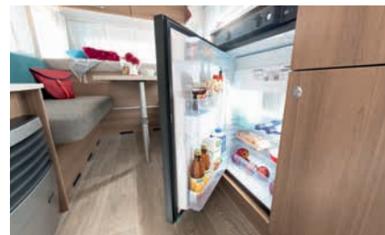
» Koelkast 81 liter met vriesvak 10 liter