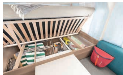
» De latten van de lattenbodem zijn geplaatst in rubber houders. Opklapbaar voor optimaal in- en uitladen.