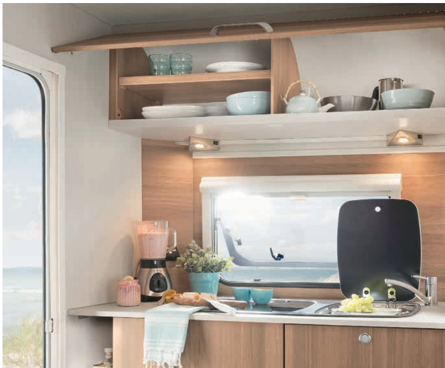
» Ruime bovenkasten