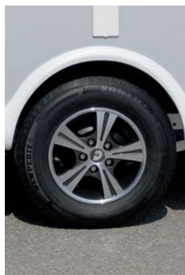
+ Hoogwaardige merkbanden en aluminium velgen