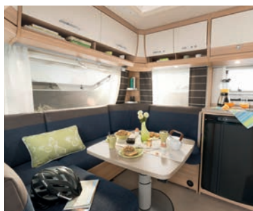
+ Royale rondzit in speciale bekleding Pepe (450 FR)