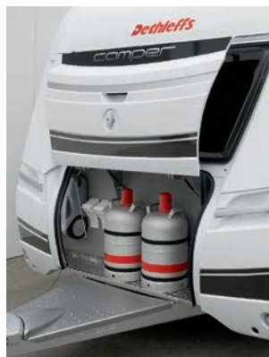
+ Stevige, geribbelde aluminium bodem en verticaal te openen disselbakklep