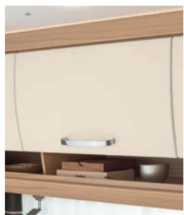
+ Bi-colour meubeldecor Rosario Cherry