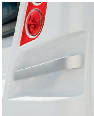
+ Chromen rangeergrepen