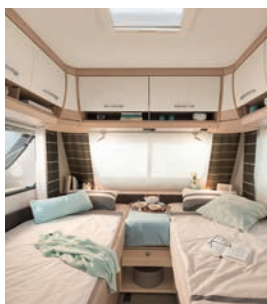
+ Twee éénpersoonsbedden met bedombouw (460 EL)