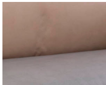
+ Bekleding Duke