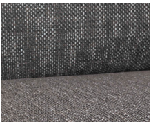
+ Bekleding Floyd