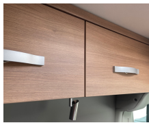
+ Meubeldecor Cape Town