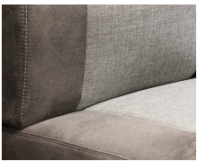
+ Bekleding Hygge